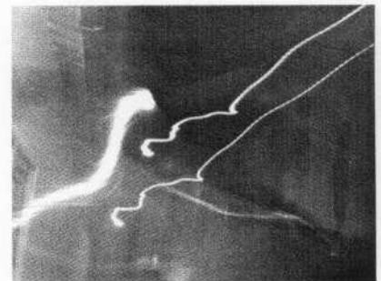
■ Une vouivre sortant d'une fenêtre

Un après midi, je me suis installée dans la salle de méditation et j'ai demandé aux Entités de recevoir un signe physique de leur présence : me taper sur l'épaule, me donner un message à l'oreille, tirer mon gilet... J'oubliais ma demande et commençais à me concentrer quand, après un temps que je ne pourrais définir, j'ai senti quelqu'un me souffler très fort dans l'oreille gauche. Ce souffle était si puissant qu'il me souleva du banc où j'étais assise. J'ouvris les yeux pour ne voir autour de moi que des personnes concentrées, complètement immobiles, les yeux fermés. Après quelques minutes pour me remettre de