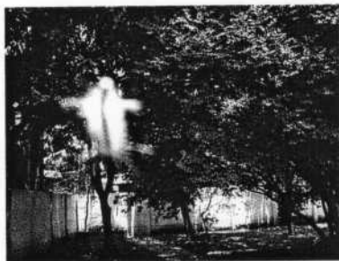
■ Maître ascensionné, photo Maryse