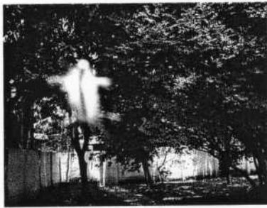
■ Maître ascensionné